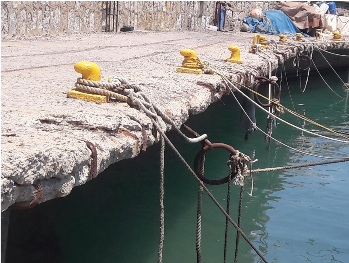
Εικόνα 1.4 Αποσάρθρωση και ζημιές στο κρηπίδωμα (πρόβολο) του Ενετικού Λιμένα