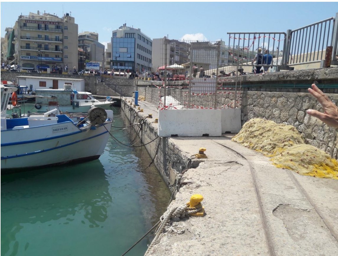
Εικόνα 1.2 Δυτικό κρηπίδωμα Ενετικού Λιμένα

Η είσοδος του Ενετικού Λιμένα σχηματίζεται από το φρούριο του Κούλε στο βόρειο τμήμα του (παλιός προσήνεμος μώλος) και τον προβλήτα του μικρού Κούλε στο νότιο, έχει δε άνοιγμα της τάξεως των 40 μέτρων περίπου.